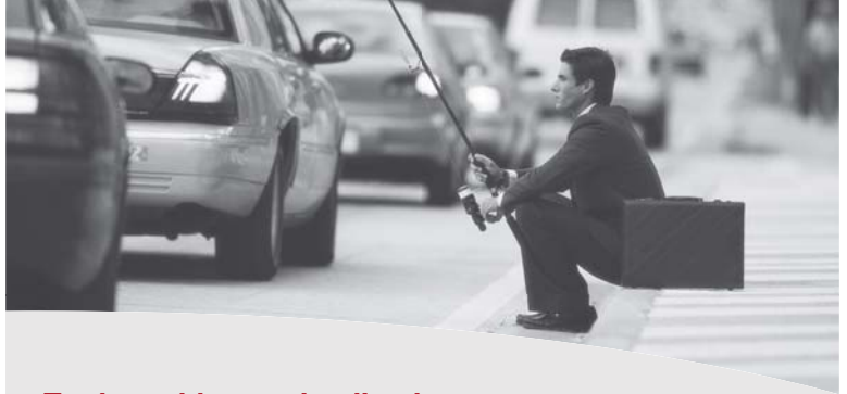
Effect top 10 positie Google